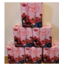
トイレットペーパー （静岡県 沼津市）