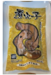
煮穴子 （茨城県 北茨城市）