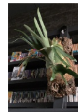
ピカクシダ （沖縄県 恩納村）