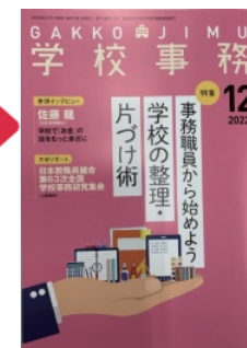
『学校事務』（学費出版）2022年12月号 ※ 全国の書店、amazonなどで販売中