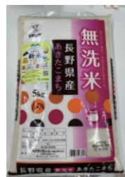
米 定期便 （長野県 千曲市）

ふるさと納税をしませんか？ 今年中に寄付すれば、令和4年分の確定申告で寄附金控除が受けられます。税理士法人水無瀬野の「スタッフいちおし ふるさと納税返礼品」をご紹介します。